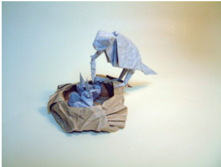
吉泽章的折纸作品