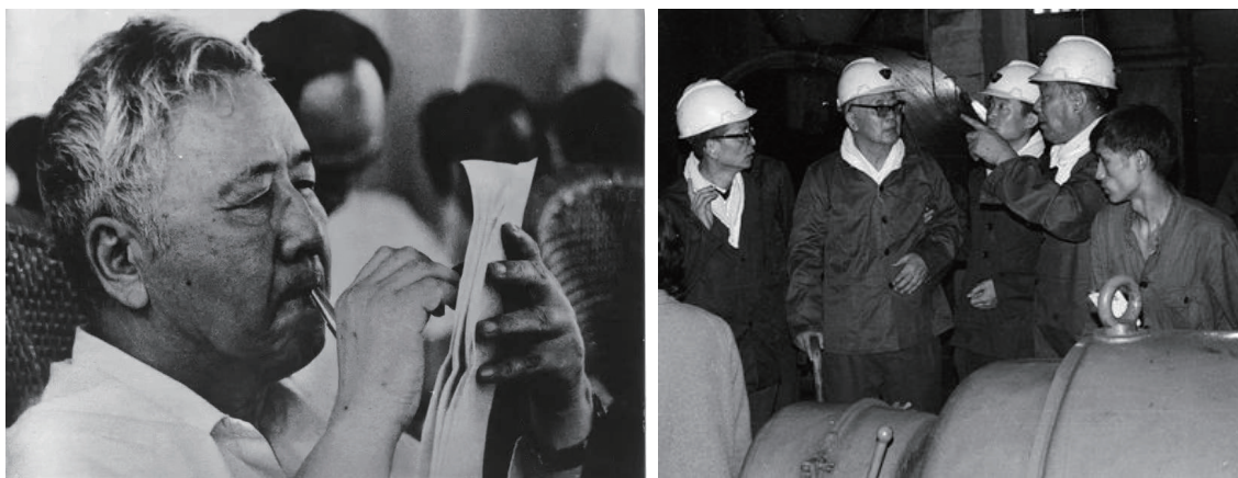
图2. 华罗庚在淮南矿区调研

华罗庚先生在矿业工程领域被誉为“精通煤矿的数学家” 5 ，因为他对煤矿生产过程有透彻的理解和熟练的掌握。他在改革开放初期，参与了“两淮”煤炭十五年发展规划和准噶尔煤矿规划的论证，从中能看出他对煤矿的精通来源于热爱。1982年，他带队三次深入淮南矿区调研，不顾年老体衰、腿脚不便的困难，先后登上12.5米高的西风井竖井大型钻机平台和40米高的副井井塔，详细观察钻机工作情况，全面了解大型矿井工程施工情况，并向操作工人做调查，掌握第一手资料。推广统筹法和优选法，心脏病发作仍坚持在病榻上听汇报、看材料。在后来煤炭部和中国科协在北京召开的“两淮”煤炭开发论证报告会上，各部门领导和专家们提出许多问题：建设速度能不能加快？多大规模合理？过去建设失误在什么地方？交通、电力、通讯等几个方面怎样同步建设？在长远战略目标下，哪年干什么？重点放在何处？等等。他带领团队都一一作答，数据可靠，材料扎实，大家非常满意。1985年6月，华罗庚带团赴日本访问的重头戏是准噶尔煤矿报告会。准噶尔煤矿是由日本政府带团建设