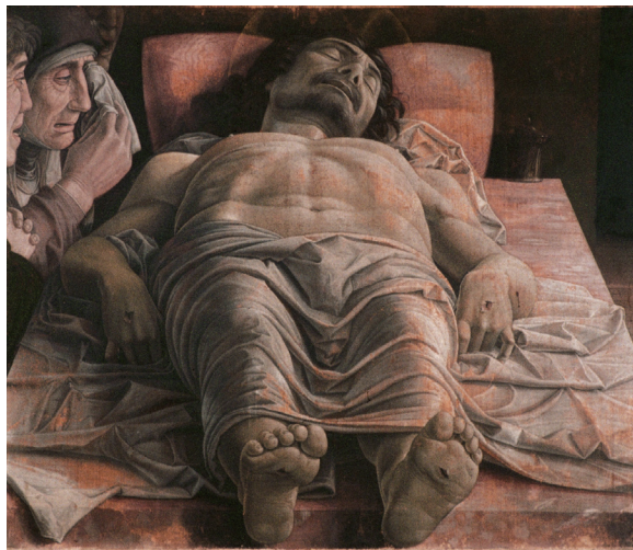
曼特尼亚作品《哀悼基督》