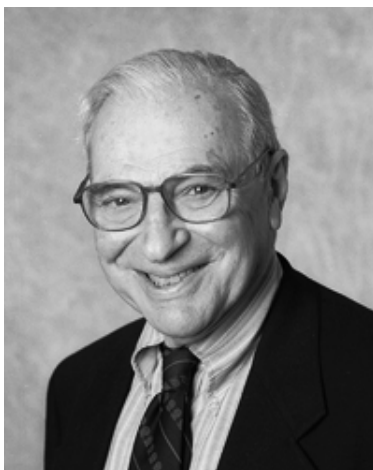
肯尼斯·阿罗(Kenneth Arrow) 1972年诺贝尔经济学奖得主

如果把数学的研究对象只用“数”和“形”来概括，那么有些东西还无法概括进去，比如数学语言学。各种计算机的语言都是根据数学原理制作出来的，可语言是“形”还是“数”呢？看来都不是。又比如在“选举”办法上，一个非常有名的结论——阿罗不可能性定理[3]。阿罗(K. Arrow)是个经济学家，诺贝尔奖获得者，学数学出身。他证明了一条定理：对于不少于3个候选人的选举按“排序”投票，不存在任何同时遵循以下四个原则的群体决策：