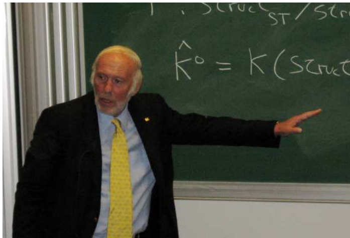
詹姆斯·西蒙斯 (James Simons) 是世界级的数学家，曾和陈省身作出了以他们的名字命名的定理。他也是最伟大的对冲基金经理之一。2010年，他以85亿美元跻身福布斯世界富人榜的第80位。

我们不仅要关注主修数学学科学生的教学改革，也要关心其它学科的数学课程改革。事实上，数学在其它学科中应用的新的生长点往往首先是由该学科的研究者开始的，而且要使数学家能够进入这个领域工作，也必须有该学科的研究者的帮助与支持。在这个意义上说其它学科数学课程的改革和数学学科的课程改革一样重要。