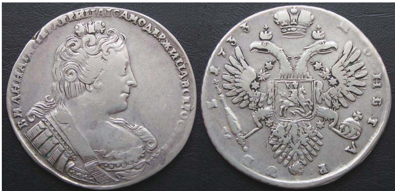
1733 年安娜女沙皇时期的 1 卢布银币