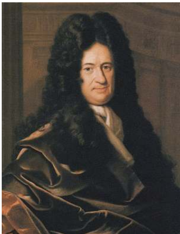
莱布尼茨 (1646-1716) 与牛顿相互独立地发明了微积分

局面，意义之大无法估量。由于莱布尼茨与牛顿对于微积分发明的优先权问题，导致了欧洲大陆数学家与英国数学家一个多世纪的争论，最终人们公认，莱布尼茨与牛顿相互独立地发明了微积分。