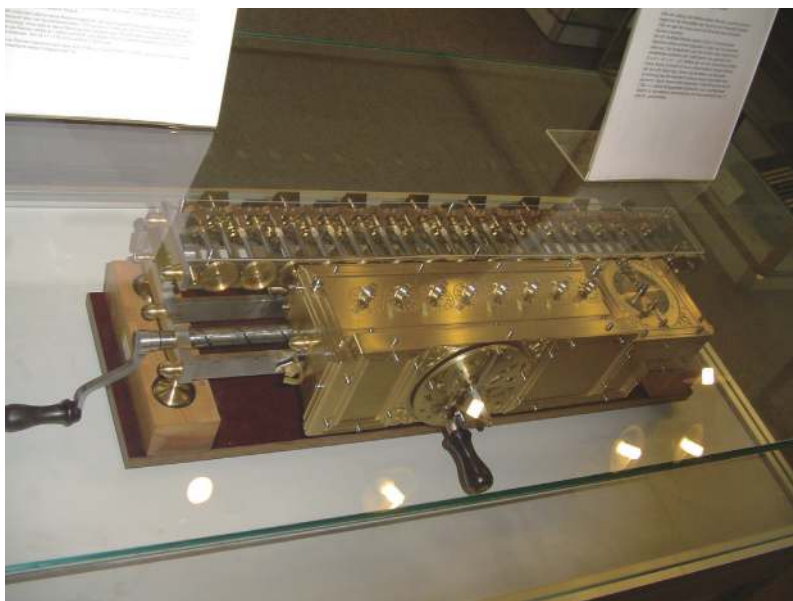
微积分的共同发明者莱布尼茨（左）同时也是机器数学的实践者；他在三百多年前就研制了一台手动数字计算机（右）