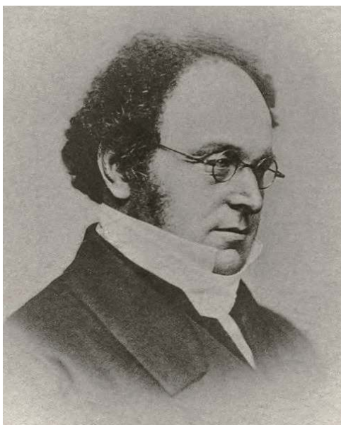
“四色定理”示意图（左）；最早试图证明四色定理的摩尔根（Augustus De Morgan, 1806-1871）（右）