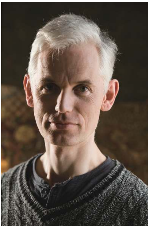
《普林斯顿数学指南》主编 Timothy Gowers 是剑桥大学教授，1998 年菲尔兹奖获得者

在现代数学众多的分支学科中，《指南》着重强调了数论、代数几何、拓扑学、表示论等基础分支学科的重要性，这是特别值得我们注意的。根据 20 世纪数学发展的主要潮流和在未来的发展前途，该书认为现在的学生应该着重学习的现代数学分支学科依次为：代数数论、解析数论、计算数论、代数几何、算术（代数）几何、代数拓扑、微分拓扑、参模空间、表示论、几何与组合群论、调和分析、偏微分方程、广义相对论、动力系统、算子代数、镜像对称、顶点算子代数、代数组合学、概率组合学、计算复杂性、数值分析、集合论、逻辑与模型论、随机过程、概率模型和概率模拟等 26 门分支学科。这与目前我国国内对现代数学分支学科的划分与强调有不小的差异。我们比较重视让学生学习偏微分方程、计算数学、泛函分析、微分几何等比较传统经典的学科。但是另一方面，对数论、代数几何以及拓扑学等主流的基础学科，我们缺乏必要的关注与投入。这其实也是导致我国基础数学研究水平还处于较低层次的一个主要原因。例如目前国内上百所设置了数学专业的高校中，只有个别几个学校能够