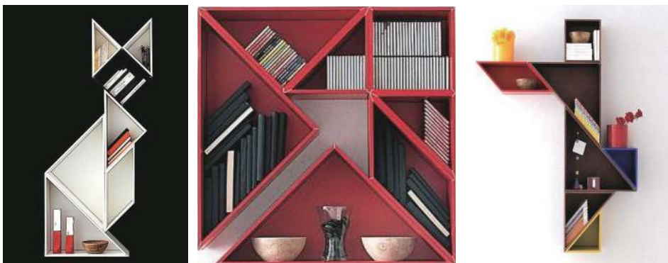
经由七巧板组合而成的书架

还记得么？在我们的孩提时代，有许多次与七巧板游戏相遇。画片中的“七巧板”由一个正方形分割而得，中有五种不同的形状，共有七块；奇妙的是，这七块看似简单的图案却可以拼排成千变万化的几何图形，形似各种自然万物，“纵横离合，变化无穷”。