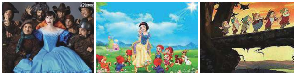
白雪公主与七个小矮人