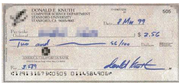
图 2 高德纳的 2.56 美元奖励支票

根据我自己有限的阅读体验，高德纳书写的很好。他的悬赏纠错体现的是他追求完美的一贯态度，没有半点为自己的书做广告的嫌疑，反而可以看作是他在鼓励读者认真读书。我在大学一、二年级，在还不知道高德纳是如此的大名鼎鼎的时候，在图书馆见到一本他的《计算机程序设计艺术》，就被吸引，记得参加义务劳动期间还摩挲此书，偷空阅读，有努力看完的冲动。但遗憾的是，此后从没翻过。但高德纳讲解 TeX 系统排版的