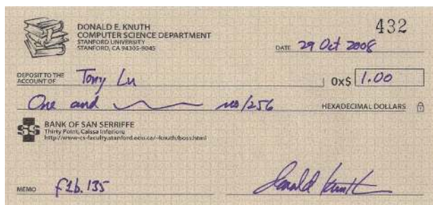
图 4 虚拟银行 San Serriffe 的支票