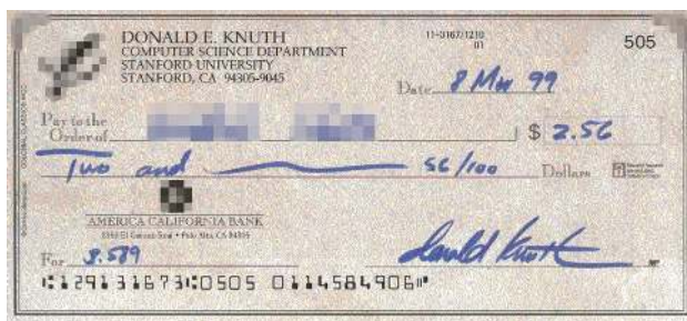
图 2 高德纳的 2.56 美元奖励支票

根据我自己有限的阅读体验，高德纳书写的很好。他的悬赏纠错体现的是他追求完美的一贯态度，没有半点为自己的书做广告的嫌疑，反而可以看作是他在鼓励读者认真读书。我在大学一、二年级，在还不知道高德纳是如此的大名鼎鼎的时候，在图书馆见到一本他的《计算机程序设计艺术》，就被吸引，记得参加义务劳动期间还摩挲此书，偷空阅读，有努力看完的冲动。但遗憾的是，此后从没翻过。但高德纳讲解 TeX 系统排版的