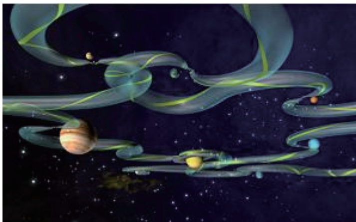
星际之间的高速公路

对于航天飞行, 过去人们都单纯地只考虑二体问题。从地球出发, 这二体就是飞船和地球。到达月球, 这二体