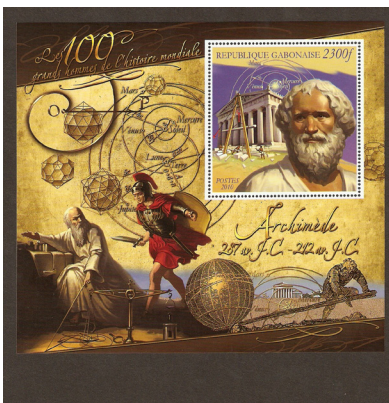
阿基米德之死 (加蓬, 2010)

命题。而那个命题又用到前面另一个命题，他又读了那另一个命题。最后他终于读完毕达哥拉斯定理的整个证明以及所用到的所有命题，终于对它深信不疑。从此，他对几何学产生了浓厚的兴趣。 3 那一年，霍布斯四十岁。